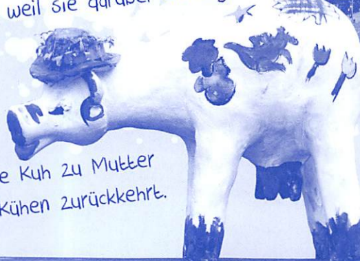
Milly in New York

Milly ist eine flecklos weiße Kuh aus Ostfriesland und weil sie darüber so unglücklich ist, geht sie auf Reisen, um in verschiedenen Ländern Formen und Farben zu sammeln. Ein kleines U-Boot bietet den Lesern Platz, damit sie Milly auf dieser spannenden Reise um die Welt begleiten können. Staunt, wie sich Millys Fell verändert und sie als bunte Kuh zu Mutter Else und den anderen Kühen zurückkehrt.